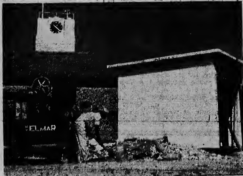
Hopi mas coriente ta worde usa actualmente.

Aruba ta progresando. Hopi mas hende ta hanjando un lugar riba nos dusji Isla pa biba. Pa nos por tene paso cu e progreso aki, nos ta fabricando diferente kas di transformador. Riba e foto aki tuma na Fort Zoutman, nos por mira nan ta fabricando un di e kasita nan.